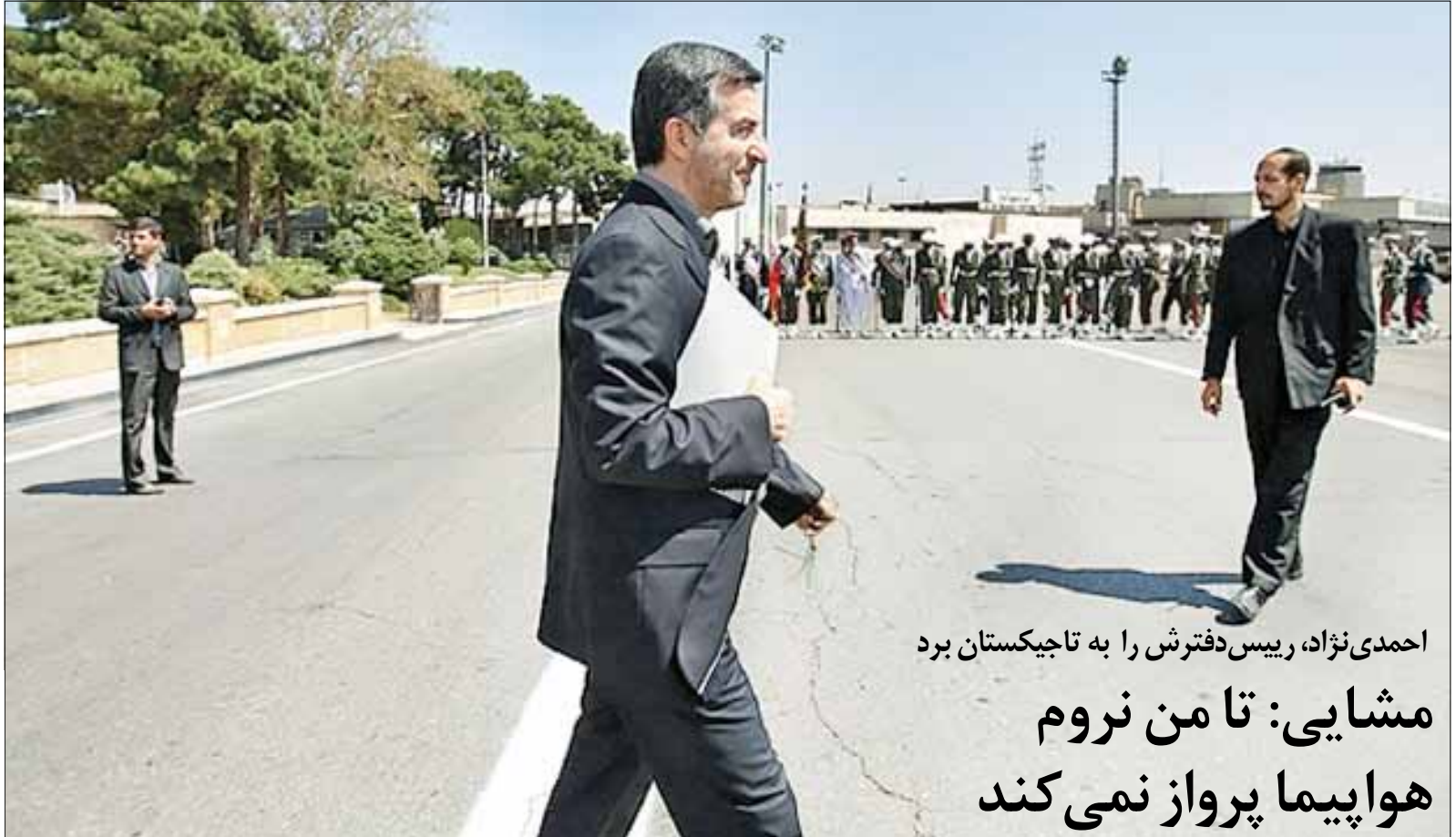
احمدی‌نژاد، رئیس‌دکترش را به تاجیکستان برد مشایی: تا من نروم هواپیما پرواز نمی‌کند