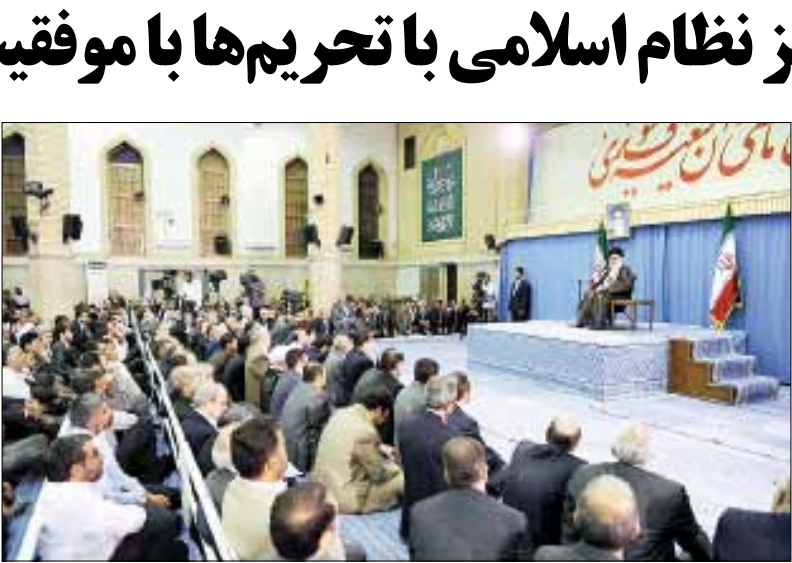
سخنرانی سالیانه دفتر مقام معظم رهبری