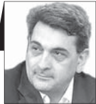
بیروز حاجی شهردار سابق تهران

سوم جولای را روز جهانی بدون کیسه‌های پلاستیکی عنوان کرده‌اند؛ (Plastic Bag Free Day) و این موضوع از این جهت بسیار بااهمیت است که میزان امحا، تولید و استفاده از کیسه‌های پلاستیکی در دنیا به شدت رو به افزایش است و کشور ما هم در این زمینه وضعیت خوبی ندارد. تاریخچه تولید پلاستیک به‌طور فراگیر به ۲۰۸۰ سال اخیر برمی‌گردد، اما در همین مدت کوتاه تأثیر بسیار زیادی بر تمام زندگی ما گذاشته؛ از لباس، لوازم منزل، اتومبیل، طراحی انواع محصولات مهندسی و پزشکی و استفاده از مواد پلاستیکی به حدی وارد زندگی روزمره شده که هیچ‌کس نمی‌تواند بدون بهره‌مندی روزانه از این مواد زندگی کند. اگرچه گسترش تولید و استفاده از پلاستیک به بهبود کیفیت زندگی کمک کرده، ولی از طرف دیگر عوارض استفاده نادرست از آن هم گریبان زندگی بشر را گرفته است. تقریباً جایی نیست که هم در کشور خودمان و هم در اقصانقاط جهان یا بگذاریم و به زباله‌های پلاستیکی بپردازیم؛ دریا، جنگل، فضای شهری، جاده‌های بین‌شهری، تالاب‌ها، اقیانوس‌ها و تقریباً هر جایی که پای بشر به آنجا رسیده، نوعی از پسماند پلاستیکی را از خودش به جای گذاشته است. آلودگی‌های پلاستیکی برای سلامتی انسان، جانوران و به‌طور کلی سلامت و کیفیت اکوسیستم محیط زیست مضرات فراوانی دارد. میکروپلاستیک‌ها وقتی به چرخه غذایی جانوران و به تبع آن انسان وارد می‌شوند، ترکیبات سمی ایجاد می‌کنند و آلودگی منابع آبی، آب‌های زیرزمینی و آلودگی خاک از جمله مواردی است که در نتیجه مصرف بالای پلاستیک به وجود آمده است.