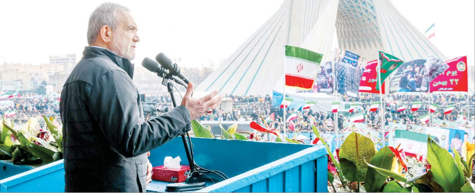
این گزارش را در صفحه ۲ بخوانید.