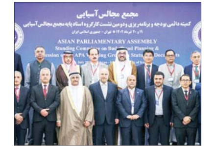
مجمع مجالس آسیایی (APA) در تهران برگزار شد