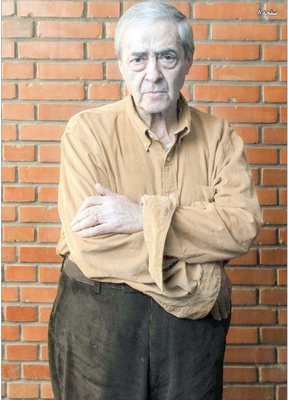
عکس: آیین ۹۰