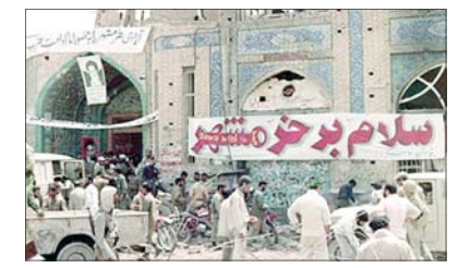
امروز، چهل و یکمین سالگرد آزادی خرمشهر است

در «شرق» امروز می‌خوانید: «شرق» از چند و چون ۲ لایحه متفاوت درباره حجاب گزارش می‌دهد؛ ۳ قوه درگیر لایحه حجاب، باغ ایتالیا انبار آهن می‌شود؟ به مناسبت تجدید چاپ اثری از شاهرخ مسکوب؛ تعهد دوگانه