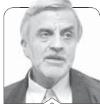
سیدمصطفی هاشمی طبا

بازدید چندساعته رهبر انقلاب از نمایشگاه دستاوردهای خلاقانه متخصصان ایرانی و صحبت‌های ایشان و نیز توصیه به مسئولان برای بازدید از نمایشگاه همه خوب و ارزشمند بود و حتما توجه مسئولان به پشتیبانی از متبکران و استفاده از آنچه پدید آمده را برمی‌انگیزد. هرچند نظام اداری و مالی کشور ما به دلایل متعدد نوعاً نمی‌تواند خطرپذیری را بیپذیرد و نیز به خاطر سواستفاده‌های متعدد افراد در نظام پولی- بانکی کشور و اعطای تسهیلات مالی اجباری، متبکران و مخترعان برای توسعه کار، دست‌بسته هستند اما مواردی بوده که با کمک ناچیزی مجموعه‌ای تشکیل و توانی شکل گرفته است و البته نه در حد بزرگ و قابل تعمیم.