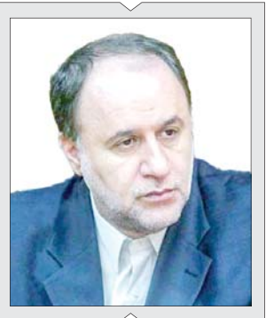
این گزارش را در صفحه ۳ بخوانید.

اعلام آمادگی برای مذاکره از سوی نایب‌رئیس مجلس