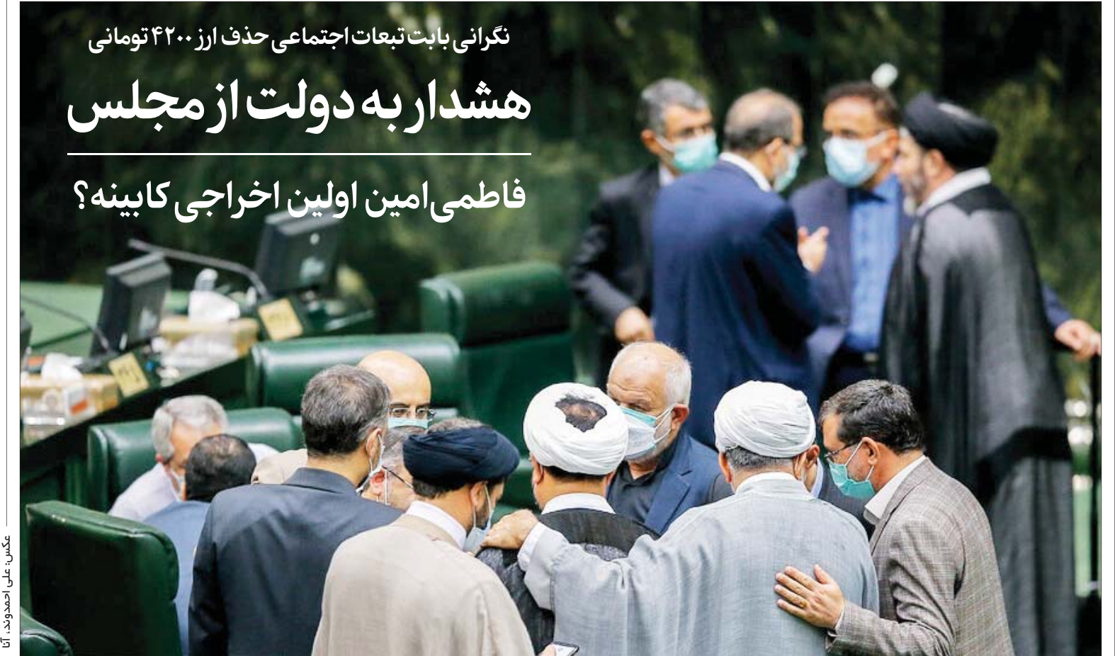
نگرانی بابت تبعات اجتماعی حذف ارز ۴۲۰۰ تومانی هشدار به دولت از مجلس فاطمی‌امین اولین اخراجی کابینه؟

یادداشت خاک در چشم مردم پاشیدن! با دومین قدرت اقتصادی جهان را داشت و منکر ضرورت رفع تنش و تحریم‌های بین‌المللی بود؟! اقتصاد تحریمی و فهرست سیاهی، اقتصاد بخور و نمیر است، نه اقتصاد رو به توسعه و پیشرفت؛ آن‌چنان‌که شعار آن در برنامه‌های توسعه‌ای و منشور، افق و سیاست‌های راهبردی کشور آمده است. ایران به‌عنوان کشوری که توانایی فرارفتن بسیار دارد و با یک درصد جمعیت جهان، حدود ۹ درصد منابع، ذخایر و مزیت‌های اقتصادی جهان را در اختیار دارد، نباید در حد اقتصادهای بخور و نمیر سقوط کند! کشوری که توانمندی‌های بسیار از نیروی انسانی جوان، تحصیل‌کرده، باسواد و متخصص گرفته تا منابع عظیم انرژی و معدنی و موقعیت مهم و استراتژیک جغرافیایی و قابلیت‌های فرهنگی و تمدنی بالا و شاید کم‌نظیر و... نباید به اقتصاد بخور و نمیر افتخار کند! این تأسف و وقتی عمیق‌تر می‌شود که نام کشورهای کره جنوبی، ترکیه و عربستان را در بین ۲۰ کشور ثروتمند (جی ۲۰) مشاهده می‌کنیم؛ کشورهایی که تا همین چند دهه قبل اقتصادی کوچک‌تر از اقتصاد ایران داشتند. اینکه چرا چنین شد و کشورمان نتوانست با وجود شایستگی‌های بسیارش کشور توسعه‌را به درستی بیمباید و اکنون جزء این کلوب و مجمع ۲۰ کشور ثروتمند باشد، سؤالی بس مهم است. همه کارشناسان بر این امر تأکید دارند که امر توسعه در هر جامعه‌ای با میزان تولید ثروت در آن جامعه نسبت دارد و ثروت‌آفرینی با امنیت و ثبات گره خورده است. تولید ثروت نیازمند ارتباط، تعامل و دادوستد با جهان است که این نیز از پاشنه‌های آشیل کشورمان در دهه‌های اخیر بوده است.