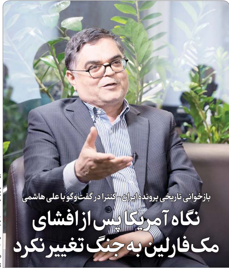
گزارش تیریکرا در صفحه ۴ بخوانید