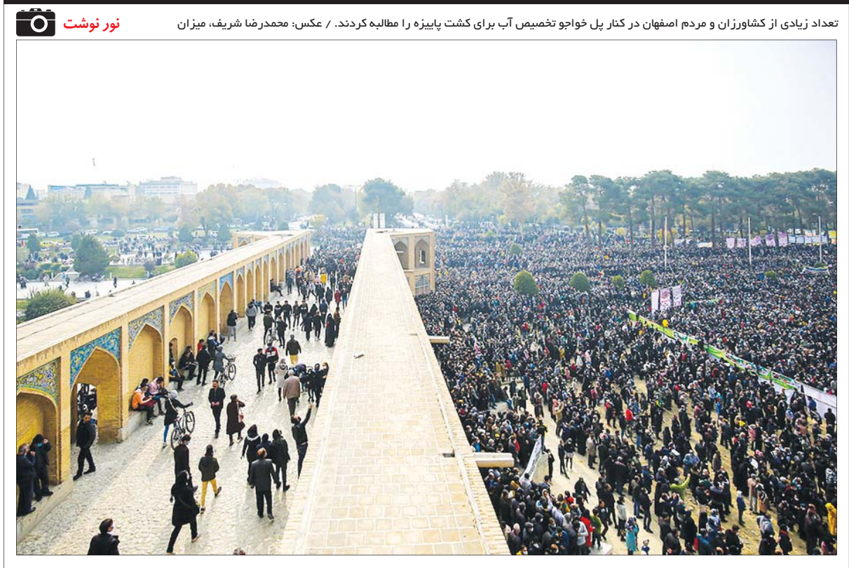
تعداد زیادی از کشاورزان و مردم اصفهان در کنار پل خواجو تخصیص آب برای کشت پاییزه را مطالبه کردند.