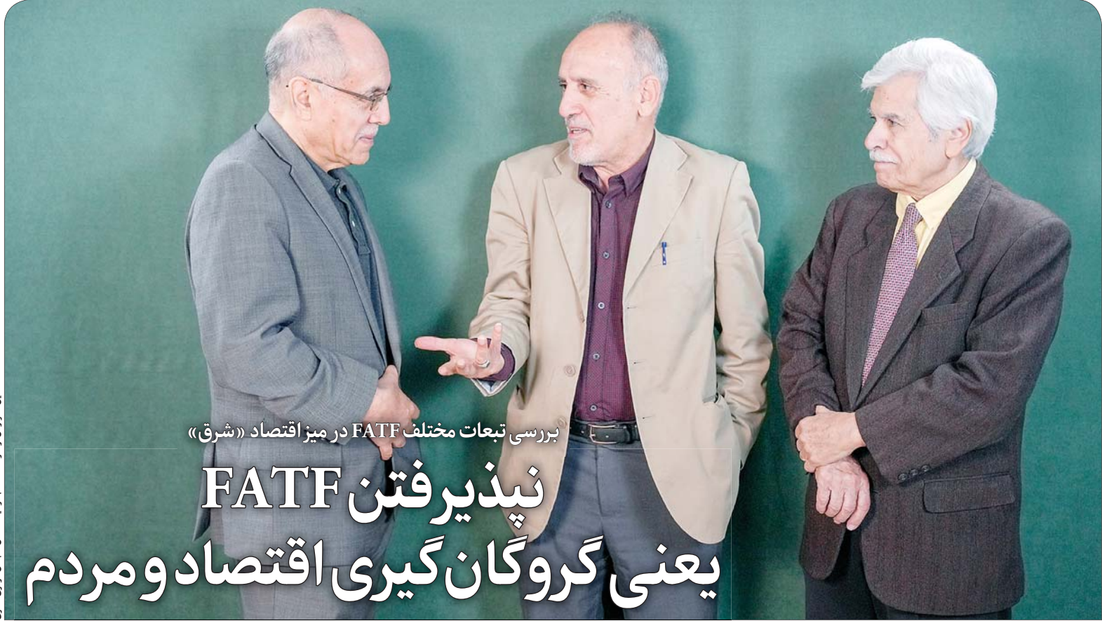
بررسی تبعات مختلف FATF در میز اقتصاد «شرق»