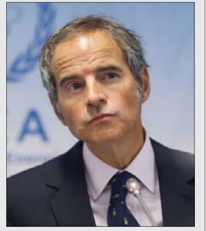
«شرق» از سفر مدیر کل آژانس بین‌المللی انرژی اتمی به تهران گزارش می‌دهد