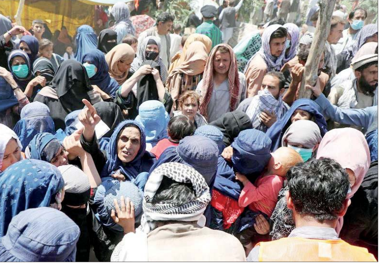
افغانان زن افغانستان با صدای بلند اعلام می‌کنیم که زنان افغانستان شهروندانی برابر هستند و حقوق انسانی آنها می‌بایست در هر مذاکرات صلحی به‌عنوان پیش‌شرط مطرح و مورد قبول طرفین قرار گیرد. زنان افغانستان نباید بار دیگر قربانی جنگ‌های نیابتی شوند و دستاوردهایشان در آتش جنگ‌هایی که در آن نقشی ندارند، از میان برود. ما از دبیرکل سازمان ملل، شورای حقوق بشر سازمان ملل، نهادهای حقوق بشری جهان و جامعه جهانی می‌خواهیم تا پیش از آنکه افغانستان به قتلگاه زنان تبدیل شود، صدای ما را بشنوند و برای دفاع از حقوق بشری مردم افغانستان مداخله کنند.»

بیش از هزارو ۲۰۰ فعال حقوق بشر ایرانی و افغان در نامه‌ای سرکشاده از خواسته‌های زنان افغان، حمایت کردند و به سازمان ملل، نهادها و سازمان‌های جهانی مدافع صلح اعلام کردند که همبای زنان افغانستان، خواستار آتش‌بس فوری، صلحی عادلانه و اقدامات مسئولانه برای پایان‌بخشیدن به جنگ آغازشده از سوی طالبان هستند. در این نامه سرکشاده آمده است: «ما دوستان واقعی افغانستان، امضاکنندگان این نامه سرکشاده، حمایت خود را از خواست‌های زنان افغانستان که در زیر ابراز شده، اعلام می‌داریم و هم‌صدا با آنان سازمان ملل متحد، دولت افغانستان و بازیگران ذی‌دخل ملی و بین‌المللی را به انجام تعهدات و درپیش‌گرفتن اقدامات مسئولانه برای پایان‌بخشیدن به جنگ و تحقق صلح عادلانه همه‌شمول که حافظ منافع و حقوق همه باشندگان این سرزمین اعم از زن و مرد باشد، فرامی‌خوانیم. زنان افغانستان بیش از ۴۰ سال است که جنگی خانمان‌سوز را تحمل می‌کنند. جنگی که در آن هیچ نقشی نداشته‌اند و کرامت انسانی‌شان به طور مداوم و روزمره مورد هجوم قرار