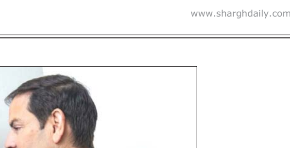
رئیس‌جمهور آمریکا، دونالد ترامپ، با رئیس‌جمهور چین، شی جین‌پینگ، در جریان دیدار در واشینگتن، ۲۰۲۰

درخواست‌ها برای شناسایی چین به‌عنوان یک تهدید امنیت ملی در بریتانیا افزایش یافته است، اما مقامات همچنان با احتیاط عمل می‌کنند و مراقب تاثیر احتمالی این اقدام بر روابط تجاری حیاتی هستند. مؤسسات مالی نظیر اچ‌اس‌بی‌سی نیز هشدار داده‌اند که اقدامات سخت‌گیرانه به منافع تجاری لطمه وارد می‌کنند. جامعه اطلاعاتی آمریکا، رژیم چین را به‌عنوان بزرگ‌ترین تهدید امنیت ملی شناسایی کرده و وزارت امنیت میهن بر نقش این رژیم در تهدیدات اقتصادی و سایبری و مشارکت آن در بحران فنتانیل از طریق تأمین پیش‌سازهای شیمیایی برای کارتل‌های مکزیک ی تاکید دارد. دولت‌های غربی و به‌ویژه آمریکا، حزب کمونیست چین را به‌عنوان یک تهدید مهم امنیت ملی شناسایی کرده‌اند، باین‌حال، کارکرد سیاست‌های لیبرالی آنها اغلب به دلیل نگرانی از ایجاد مشکل برای جوامع دور از وطن چینی، پیش‌داوری نژادی یا آسیب‌دیدن روابط تجاری و سرمایه‌گذاری محدود می‌شود. حزب کمونیست چین به این محدودیت‌ها واقف بوده و از آنها برای ادامه عملیات سری خود بهره می‌گیرد. یکن هم‌زمان رسانه‌ها و شبکه‌های اجتماعی را برای پیشبرد روایتی به کار می‌گیرد که می‌گوید ادعاهای جاسوسی بدون پایه و اساس هستند و ریشه در نژادپرستی دارند.