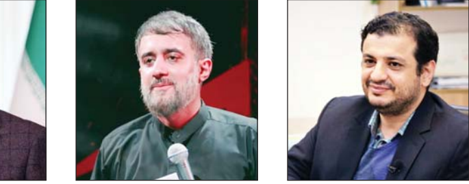
محمدپوریا کیوان، عازرادی‌های ماه محرم ۱۴۰۲ حواشی مختلفی داشت که مهم‌ترین آنها را در گزارش پیش‌رو می‌خوانید.

عربستان به دنبال بازی با برگ ایران پیرو گزاره تحلیلی مهدی ذاکریان، توماس فریدمن در مطلب خود برای نیویورک‌تایمز از سه پیش‌شرط مهم سعودی‌ها برای عادی‌سازی روابط با اسرائیل برای واشنگتن