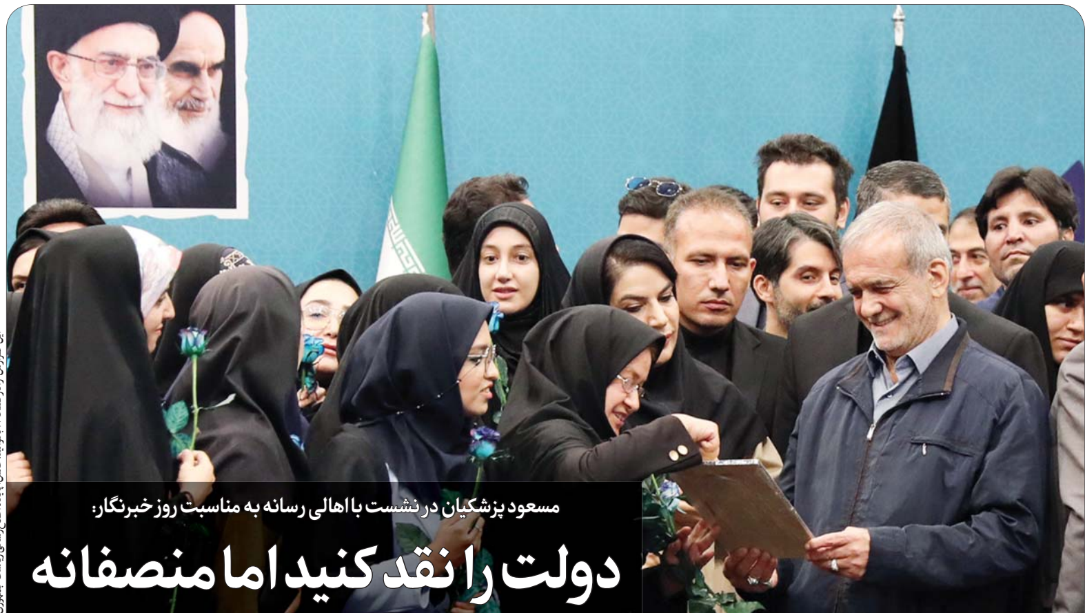
این گزارش را در صفحه بخوانید.

این پرونده را در صفحه‌های ۳، ۴ و ۵ بخوانید