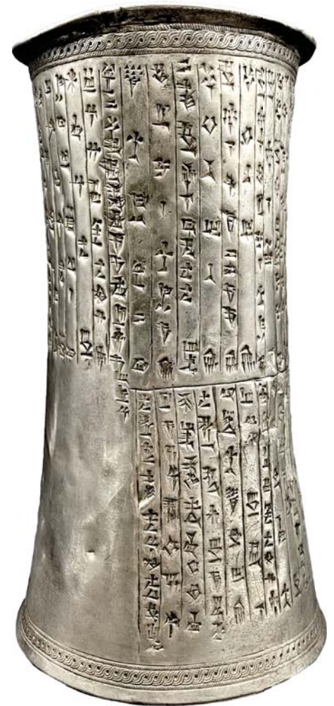
• تصویر ۹: ظرف نقره‌ای با کتیبه‌های سلطنتی به خط میخی و زبان عیلامی متعلق به نیمه نخست سده ۱۸ پیش از میلاد از فرمانروا سو-پالار-هوهپاک (Sewe-palar-hühpak) (ارتفاع بیست و یک و نیم سانتی‌متر؛ از مجموعه محبوبیان)

رمزگشایی خط «عیلامی خطی» ثابت کرد که این خط برای ثبت «زبان عیلامی» استفاده می‌شده است. زبان عیلامی احتمالاً از بقایای یک گروه زبانی بزرگ‌تر در هزاره سوم پیش از میلاد بوده و نیز این زبان نشان‌دهنده تفاوت‌های گویشی/لهجای بین‌منطقه‌ای در طی