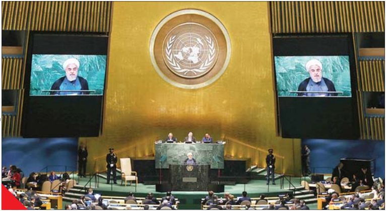
روحانی پیش از این سسه بار در جریان مجمع عمومی سخنرانی کرده است