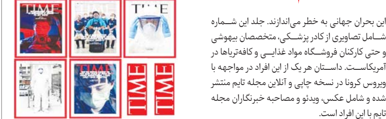
تصویر: مجله تایم، مجله تایم، مجله تایم، مجله تایم، مجله تایم

این بحران جهانی به خطر می‌اندازند. جلد این شماره شامل تصویری از کادر پزشکی، متخصصان بیهوشی و حتی کارکنان فروشگاه مواد غذایی و کافه‌تریاه‌ا در آمریکاست. داستان هر یک از این افراد در مواجهه با ویروس کرونا در نسخه چاپی و آنلاین مجله تایم منتشر شده و شامل عکس، ویدئو و مصاحبه خبرنگاران مجله تایم با این افراد است.