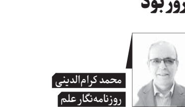
محمد کرام الدینی روزنامه نگار علم

از صبح روز سه شنبه که خبر جان دادن پیروز منتشر شده تا این لحظه که نیمه های شب سه شنبه نهم اسفندماه ۱۴۰۱ است، هر جا که رفته ام، در کوچه و خیابان، در اداره، مدرسه یا فروشگاه، همه جا با موجی نسنسی از غم و اندوه روبرو بوده ام. تقریباً همه کمابیش درباره مرگ ناپهنگام و ناگهانی پیروز گفت و شنود داشته اند؛ البته، هر کس با لحن و زبان و تفسیری متفاوت، گویی تأثیر این خبر بر جامعه آن چنان عمیق بوده که تقریباً همه را غم زده کرده و در ماتم فرو برده است. ادامه در صفحه ۱۰