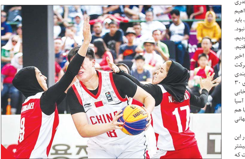
عکس، طعمه ملکپول،تسبیح

در اردوی اول ۲۰ نفر از برترین نقرات زیر ۲۳ سال کشور را که گلچینی از بهترین‌های رقابت‌های لیگ بودند، انتخاب کردیم و به اردو دعوت شدند. مطمئناً ما استعدادهای زیادی در کشور داریم که شایدسته حضور در اردوهای تیم ملی باشند؛ اما چون فرصت‌مان کم بود، براساس آمار مکتوبی که داشتیم، اردونشینان را انتخاب کردیم. تا به الان ۱۰ نفر این بازیکنان ریزش داشتند و در پایان اردوی دوم هم چهار نفر خط می‌خورند تا ترکیب نهایی را که شش نفر است، مشخص کنیم».