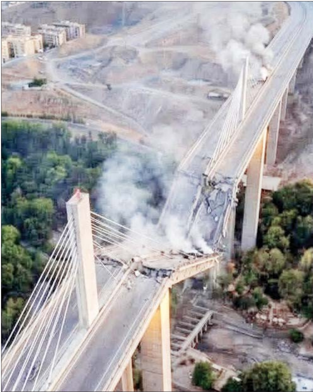
گزارش تیترا یک‌را درصفحه‌های ۴ و ۱۰خوانید