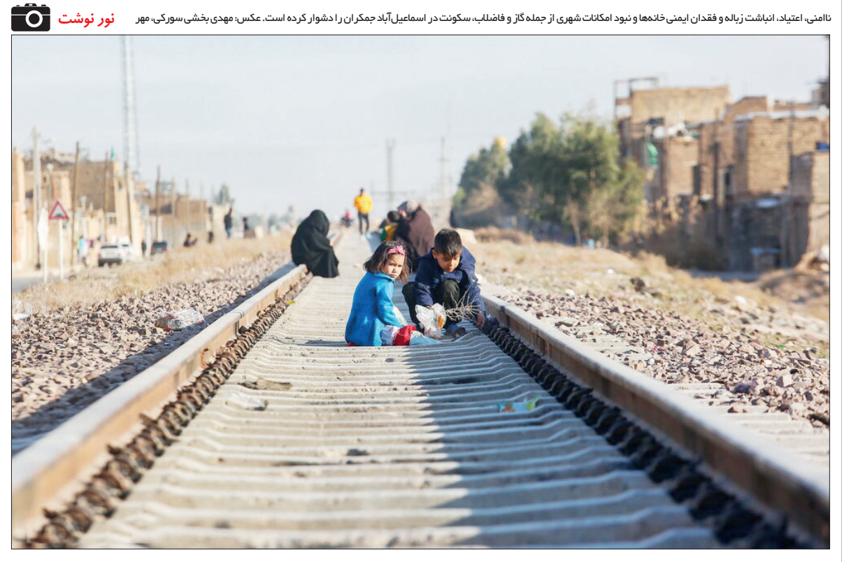
نائمی، اعتیاد، انباشت زیاده و فقدان ایمنی خاندها و نبود امکانات شهری از جمله گاز و فاضلاب، سکونت در اسامبل‌آباد چمرکان را دشوار کرده است.