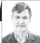
اسفندیار جهانگرد اقتصاددان