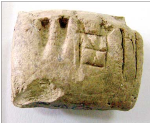
گل‌نوشته آغاز ایلامی (پروتو ایلامی) کشف‌شده از تپه یحیی B.K.2294 بخش کتیبه‌های باستان موزه ملی ایران (با مجوز موزه ملی ایران)