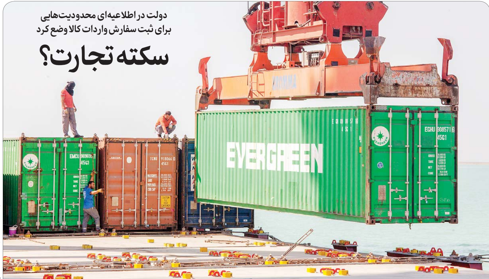
این گزارش را در صفحه ۴ بخوانید.

دولت در اطلاعیه‌ای محدودیت‌هایی برای ثبت سفارش واردات کالا وضع کرد