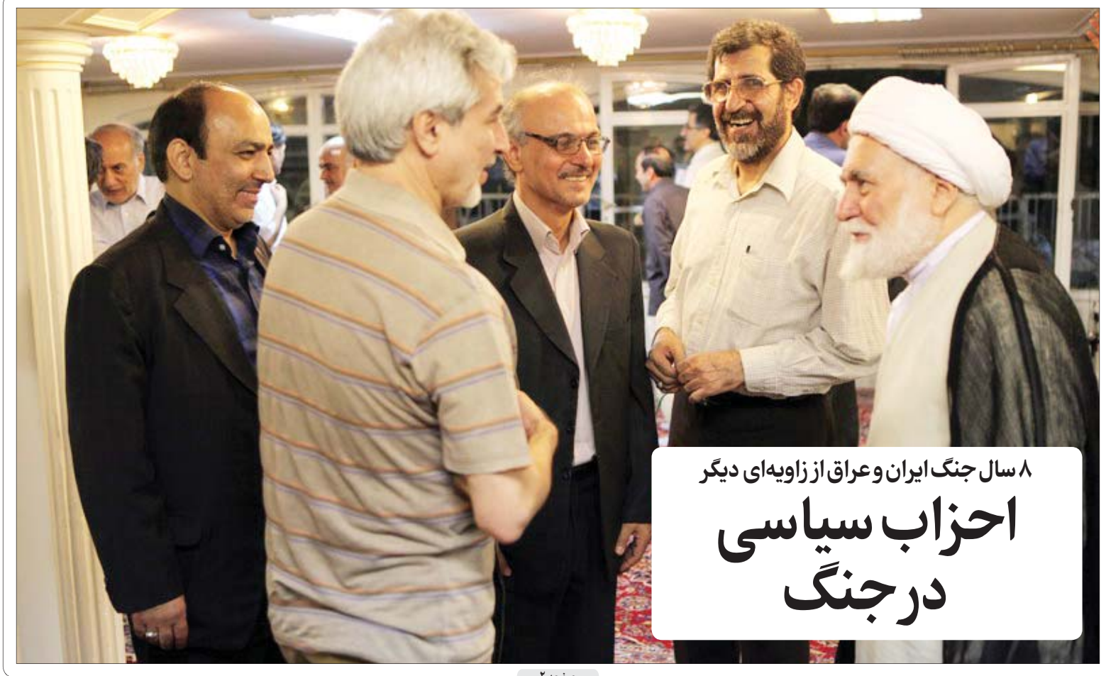
۸ سال جنگ ایران و عراق از زاویه ای دیگر احزاب سیاسی در جنگ

جزئیات نهایی اصلاحیه طرح شفافیت آرای نمایندگان منتشر شد