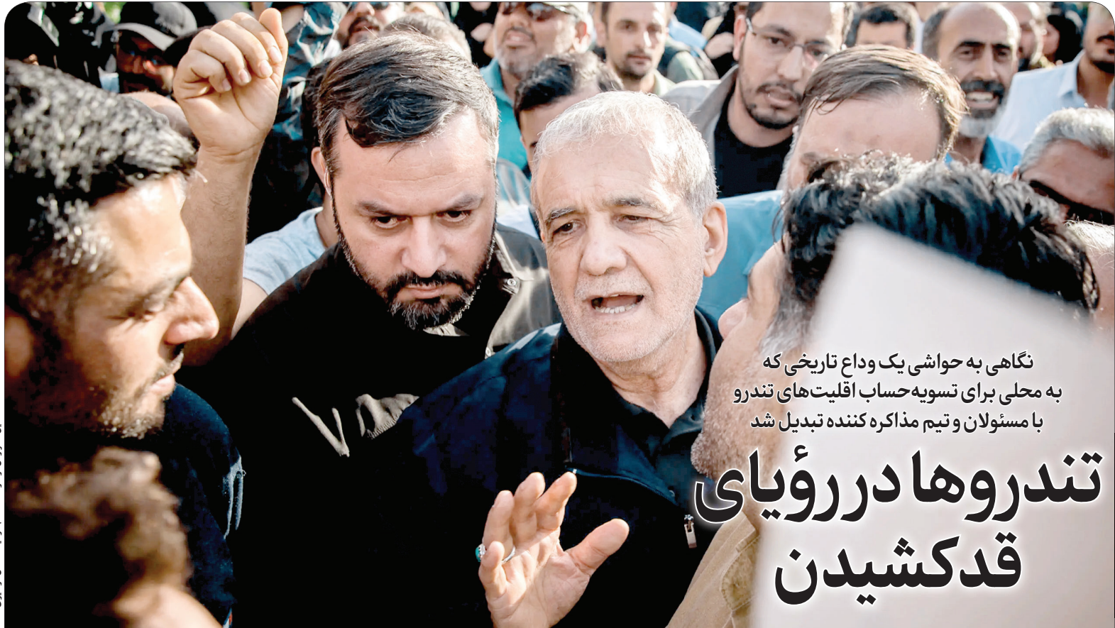
گزارش تینبریک را در صفحه ۳ بخوانید

نگاهی به حواشی یک وداع تاریخی که به محلی برای تسویه حساب اقلیت‌های تندرو با مسئولان و تیم مذاکره کننده تبدیل شد