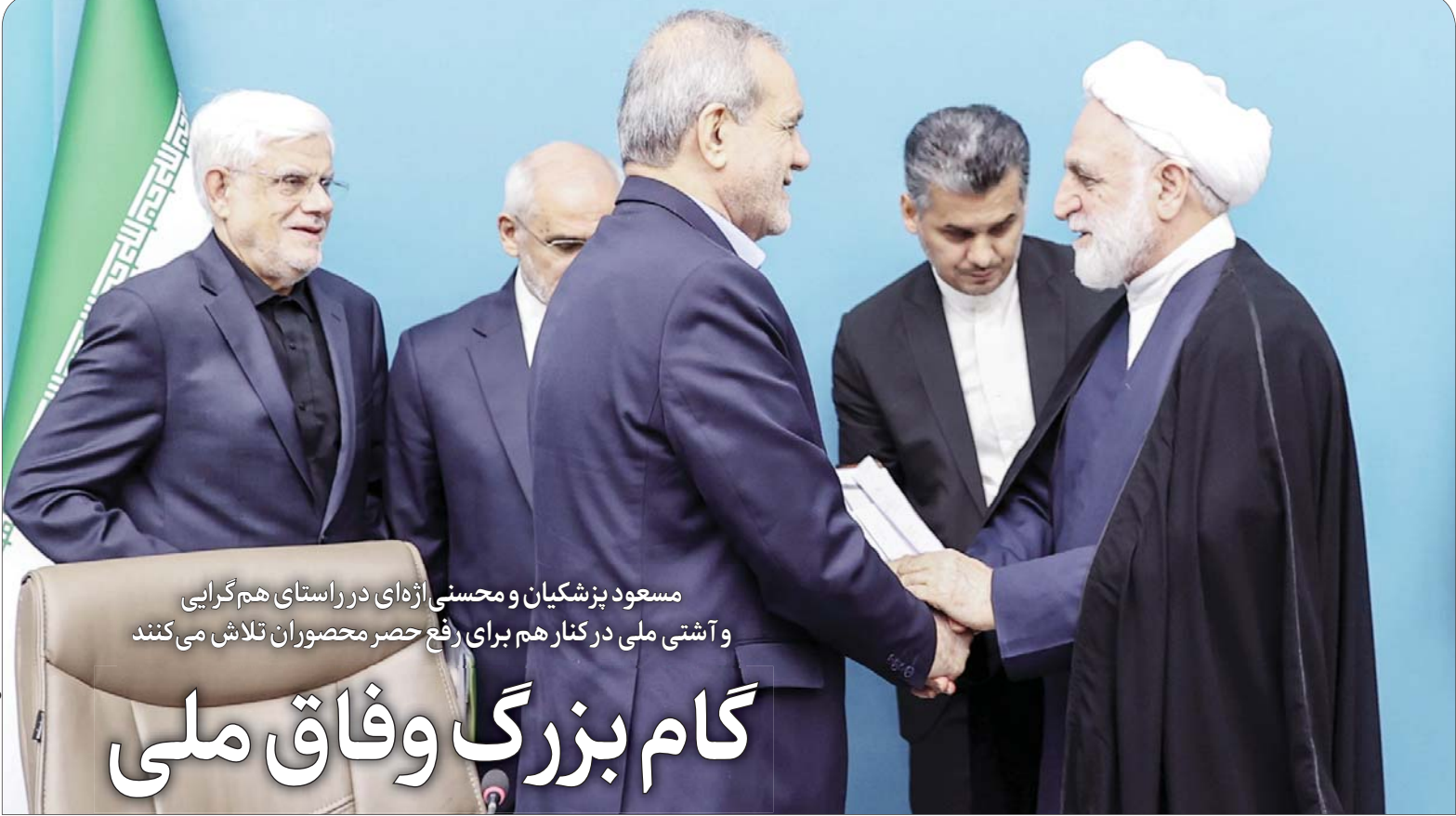
این گزارش را در صفحه ۲ بخوانید.