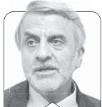
سیدمصطفی هاشمی طبا

خوشبختانه همه اعضای هیئت دولت چهاردهم از مجلس شورای اسلامی رای اعتماد گرفتند و دولت چهاردهم به صورت کامل کار خود را آغاز کرده است. دولتی که بنا بر گفته رئیس‌جمهور نباید به شیوه گذشتگان راه ببیماید و اگر چنین شود، کار به جایی نخواهد رسید (نقل به محتوا). اصل فرمایش رئیس‌جمهور محترم در این زمینه موجود است و در گذشته نزدیک در همین ستون نقل شد؛ بنابراین اعضای دولت چهاردهم موظف هستند طراحی نو درآندازند. گفتیم که برای این کار لازم است ابتدا سیاست‌های گذشته در زمینه‌های مختلف مطرح شود، یعنی سیاست‌های گذشته تحلیل (آنالیز) و سپس سیاست‌ها منقح شود. آنچه درست نبوده، حذف و آنچه درست بوده، باقی بماند و آنچه ضروری است که ابداع و نوگرایی شود، نیز تدوین و به اجرا گذاشته شود. می‌توان در زمینه‌های مختلف این شیوه را به کار برد و امید است جناب آقای رئیس‌جمهور این دستور را به وزرا ابلاغ کنند که در مدت معین سیاست‌ها و روش‌های مرسوم در وزارتخانه‌ها را فهرست کنند و به صورت فوق، بررسی و تحلیل و نتیجه‌گیری کنند.