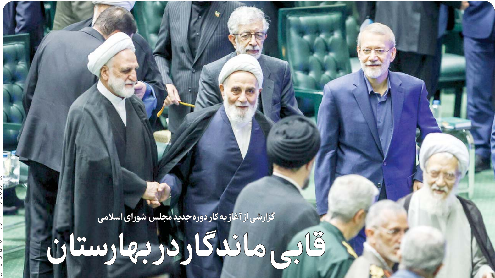
گزارش تینبریک را در صفحه ۴ بخوانید

گزارشی از آغاز به کار دوره جدید مجلس شورای اسلامی