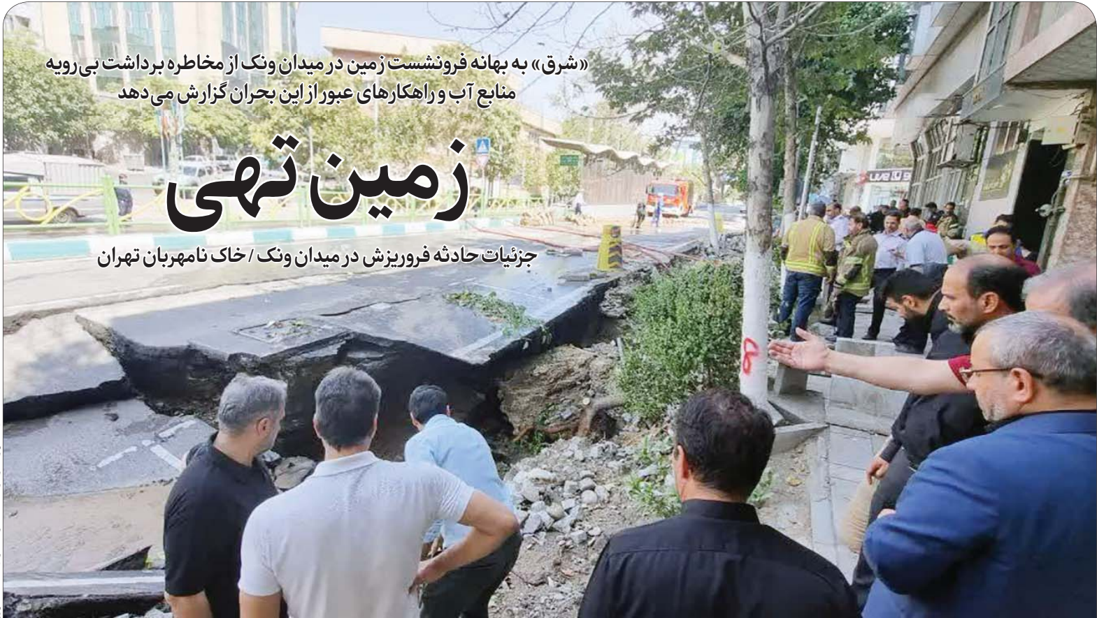
این گزارش را در صفحات ۳ و ۴ بخوانید.

«شرق» به بهانه فرونشست زمین در میدان ونک از مخاطره برداشت بی‌رویه منابع آب و راهکارهای عبور از این بحران گزارش می‌دهد