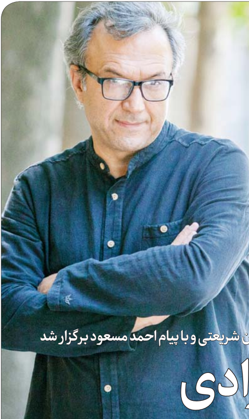
این گزارش از دو صفحهٔ «خونیند عکس سینمایی، شرق»

محمد صدر پیشنهاد داده که پزشک یان اهمیت FATF را با رهبری مطرح کند