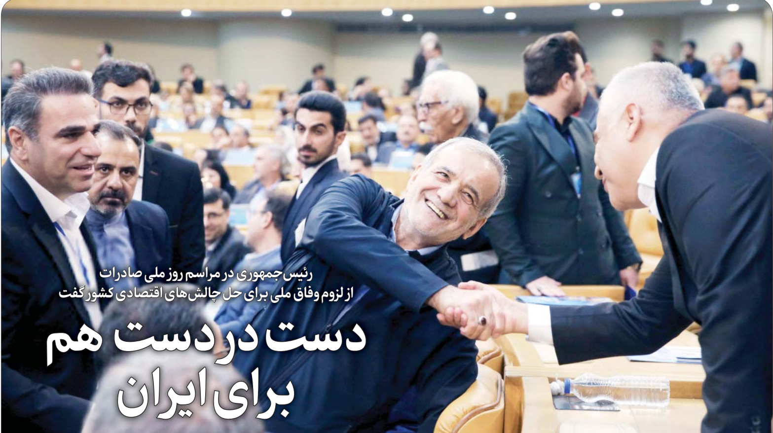
این گزارش را در صفحه ۴ بخوانید.

رئیس‌جمهوری در مراسم روز ملی صادرات از لزوم وفاق ملی برای حل چالش‌های اقتصادی کشور گفت