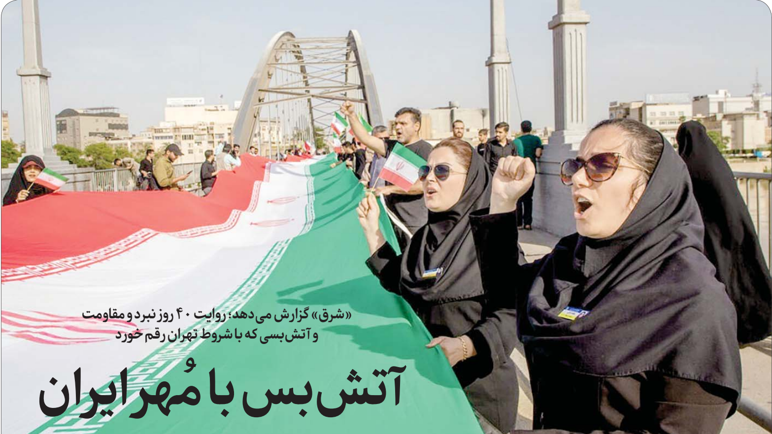
این گزارش را در صفحه ۲ بخوانید.

«شرق» گزارش می‌دهد: روایت ۴۰ روز نبرد و مقاومت و آتش بسی که با شروط تهران رقم خورد