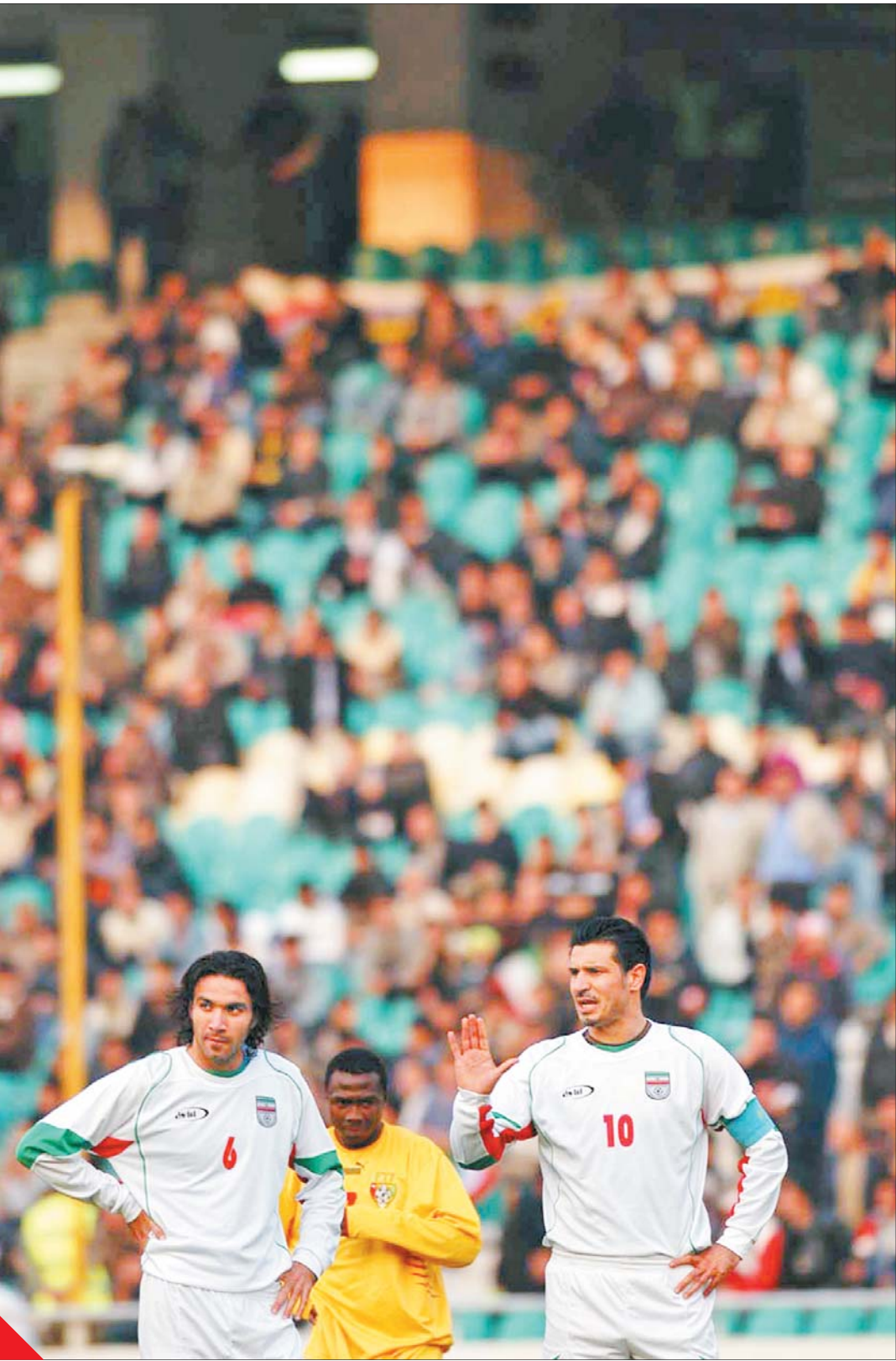
علي دايي در زمان حضور در فدراسيون فوتبال

یک آسييایي ديگر با بييش از ۵۰ گل. اين گل‌زن هندي در ۹۴ بازی ملي