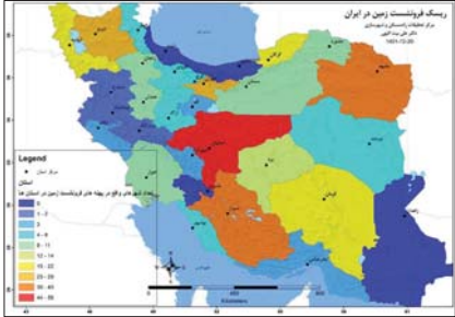
ریزش فرونشست زمین در ایران

«شرق» به بهانه فرونشست زمین در میدان ونک از مخاطره برداشت بی‌رویه منابع آب و راهکارهای عبور از این بحران گزارش می‌دهد