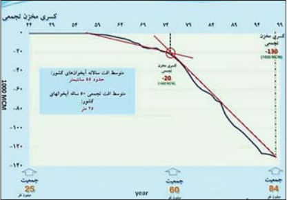
ریزش فرونشست زمین در ایران