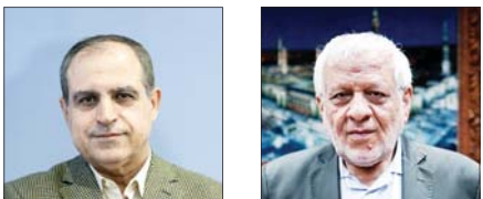
گفت‌وگوی مکتوب دیگری از دبیر کل حزب مؤتلفه اسلامی و مدیرمسئول روزنامه «شرق»