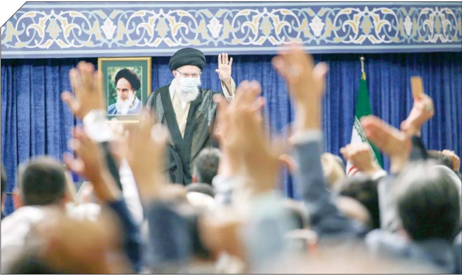
رئیس‌جمهورایران، علی‌اکبر رهبران مقام معظم رهبری

حتی برای کشورهای خلیج فارس که دوستان قدیمی و سنتی آن هستند، برنامه دارد. ایشان در تبیین نقشه آمریکا گفتند: معلومات اطلاعاتی ما نشان می‌دهد دولت آمریکا مجموعه‌ای برای بحران‌سازی در کشورها از جمله ایران ایجاد کرده که مأموریت آن یافتن و تحریک نقاطی است که به نظر آنها می‌تواند باعث بحران شود. رهبر انقلاب گفتند: از نظر آنها، تفاوت‌ها و اختلاف‌های قومی و مذهبی و مسئله جنسیت و زن جزء نقاط بحران‌ساز در ایران است که می‌خواهند با تحریک آنها به کشور عزیز ما ضربه وارد کنند اما شتر در خواب بیند پنبه‌دانه! ایشان با اشاره به تصریح برخی آمریکایی‌ها به اینکه می‌خواهند در ایران وضعیتی مانند سوریه و یمن ایجاد کنند، افزودند: آنها بدون تردید نمی‌توانند چنین کاری کنند مشروط به اینکه ما مراقب و حواس جمع باشیم، راه را خطا و اشتباه نرویم، حق را با باطل اشتباه نگیریم، روش‌های دشمن را بشناسیم، در هیچ حرف و اقدام و حرکت به دشمن کمک نکنیم و دچار خواب و غفلت نشویم، چراکه در حالت خواب، حتی یک بچه می‌تواند به شما ضربه بزند چه برسد به یک دشمن مسلح و آماده کار. حضرت آیت‌الله خامنه‌ای با تشریح ملاک و معیار قرائتی برای تشخیص راه حق از باطل، گفتند: قرآن می‌فرماید پیامبر و کسانی که با او همراه هستند، در مقابل کفار با شدت عمل می‌کنند. بنابراین اگر پیرومن راهی موجب خوشحالی کفار شد، آن راه،