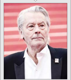
آلن دلون اسطوره اغواگر درگذشت

دوشنبه ۲۹ مرداد ۱۴۰۳ ۱۴ صفر ۱۴۴۶ ۱۹ آگوست ۲۰۲۴ سال بیست‌ویکم شماره ۴۹۰۷ ۲۰ هزار تومان ۱۲ صفحه