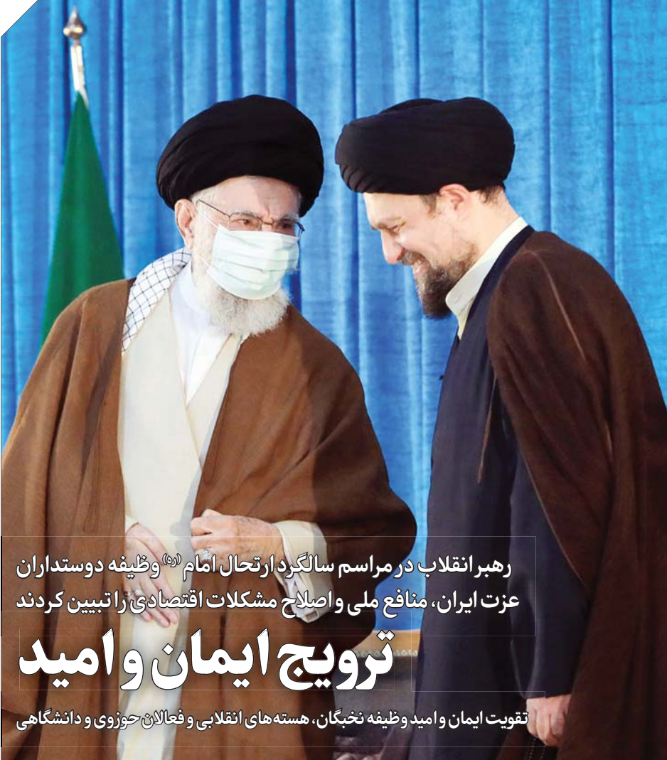
رئیس‌جمهوری پاکستانعظیم رحمانی و مقام معظم رهبری

به باور نگارنده اگرچه ما در تاریخ معاصر و ازجمله در دوره بعد از انقلاب شاهد عملکرد گرایش‌های افراطی بوده‌ایم و این گرایش‌ها گاه در موضع قدرت نیز بوده‌اند، اما مردم همیشه تمایل به میانه‌روی داشته‌اند. توجه به این نکته از این جهت مهم است که برخی نویسندگان غربی مانند گراهام فولر مدعی‌اند که «فرهنگ ایرانی نوگین است که تقریباً در همه وجوه خود تسلیم افراط است». این تصورات که آلوده به ذات‌گرایی است، مردود است؛ چراکه آنها افراطگری برخی اشخاص و طیف‌های سیاسی را به کل ملت ایران و برای همیشه تعمیم می‌دهند. درحالی‌که افراطگری و سازش‌ناپذیری در درجه اول ناشی از خود حق مطلق‌پنداری و آرمانی و ایدئولوژیک اندیشیدن بدون توجه به امکانات است. البته ساده‌اندیشی و دانش‌تن ذهن بدوی و آموزش‌ندیده و ناتوانی از درک پیچیدگی‌های بیرنج امور اجتماعی دلیل دیگر افراطگری و سازش‌ناپذیری است. در بسیاری از موارد نیز آمیزه‌ای از این دو فاجعه‌بار بوده است. البته مردم همیشه دیر یا زود و بیشتر زود متهم‌بودن کسانی را که بدون توجه به امکانات دنبال آرزوهای دور و دراز بودند، دریافته و راه خود را از آنها جدا کرده‌اند. مهم این است که بتوان میزان خساراتی را که از این رهگذر وارد می‌شود، محدود نگه داشت. اقدام دکتر طریف در جلب توجه به ضرورت اندیشیدن در چارچوب امکانات، اقدامی ارزنده است. در درستی این جمله ایشان که «برای پیشگیری از ترکمنچای‌ها باید انتخاب کنیم که آرزوهای‌مان را در چارچوب امکانات، دنبال کنیم»، تردید نیست. مهم است که هشدارهایی از این دست را پی بگیریم و بازتاب دهیم.