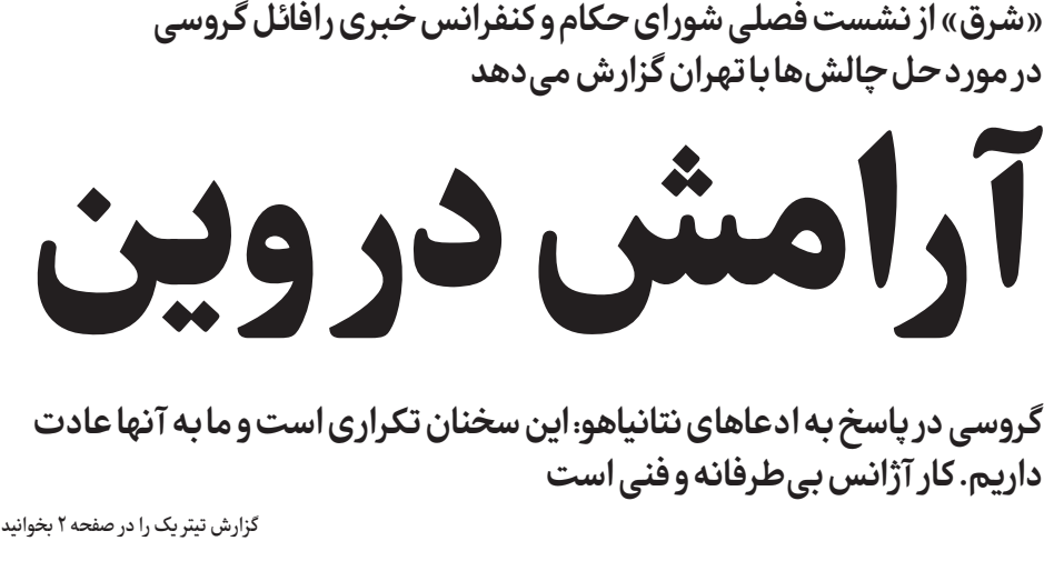
گزارش تیتربک را در صفحه ۲ بخوانید

«شرق» از نشست فصلی شورای حکام و کنفرانس خبری رافائل گروسی در مورد دحل چالش‌ها با تهران گزارش می‌دهد