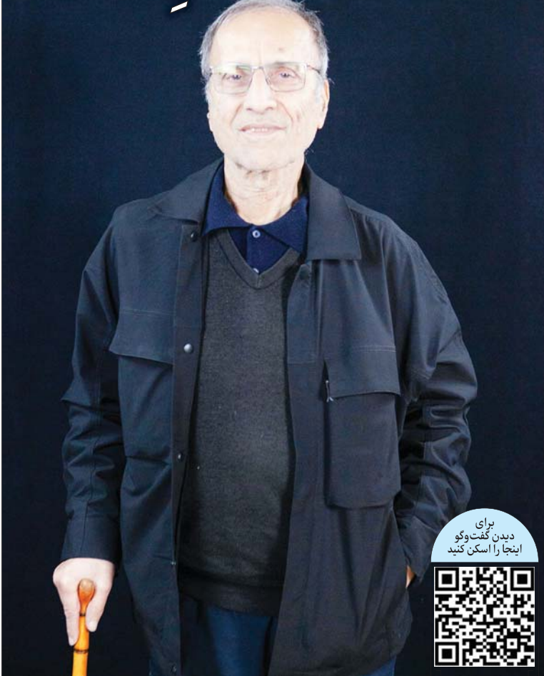
برای دیدن گفت‌وگو اینجا را اسکن کنید