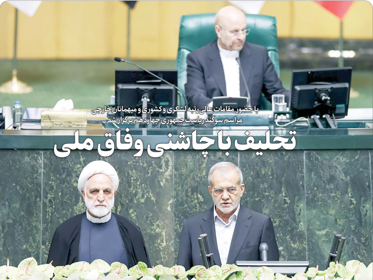
با حضور مقامات عالی‌رتبه لشکری و کشوری و میهمانان خارجی مراسم سوگند ریاست‌جمهوری چهاردهم برگزار شد