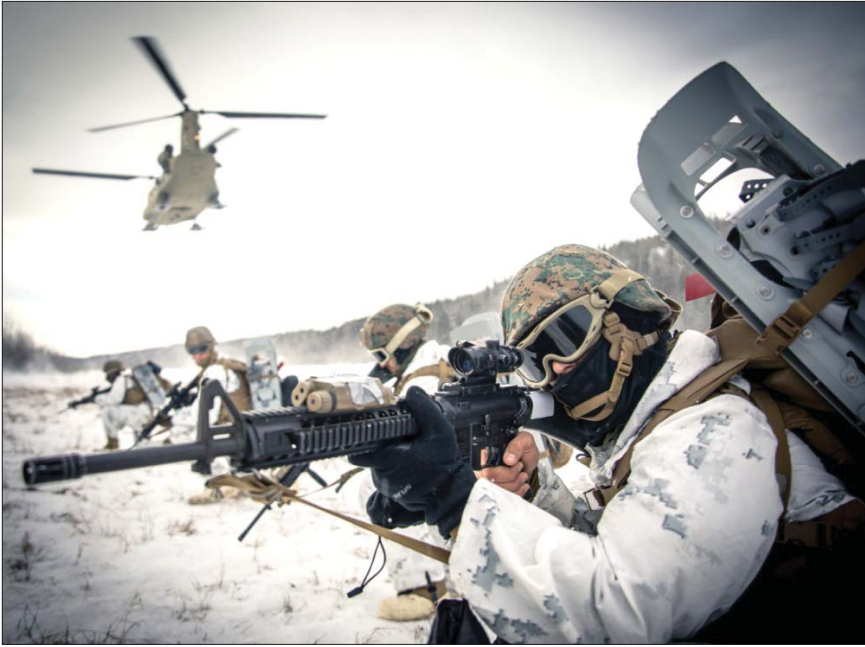
سربازان آمریکایی در حال آماده‌سازی برای عملیات در یک منطقه کوهستانی در افغانستان.