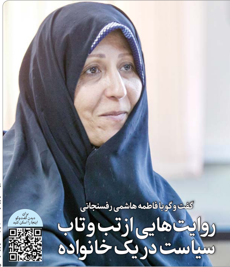
این گفت‌وگو را در صفحه ۸ بخوانید.