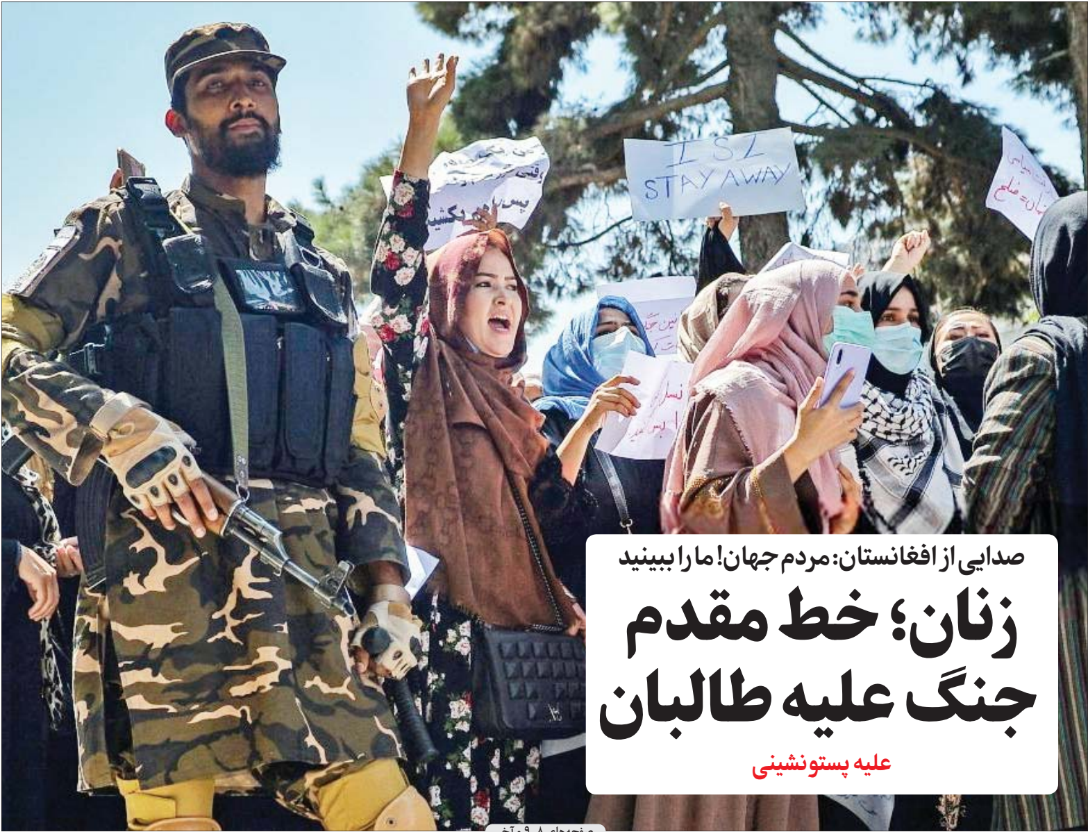
صفحه‌های ۹، ۸ و آخر