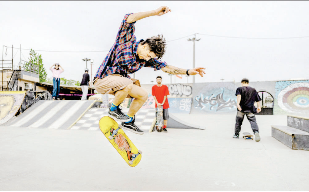
مجموعه ویپادپرک در پارک جوانیه، به‌عنوان فضایی تخصصی برای اسکیت‌برد، اسکیت و دوچرخه BMX، میزبان رویدادی پرچنب‌جوش از ورزشکاران و علاقه‌مندان این رشته‌هاست؛ مجموعه‌ای که علاوه بر برقراری رویدادهای ورزشی، امکان آموزش و استفاده از بیست را برای نوجوانان و جوانان فراهم کرده و با نزدیک‌شدن به فصل تابستان، به یکی از فضاهای فعال ورزش‌های شهری در جنوب تهران تبدیل شده است.

نشانی: تهران: میدان فاطمی، خیابان بهرام‌مصری، پلاک ۲۲ • تلفن:۵۴ و ۸۸۹۳۶۲۷۰ • شماره ۸۰۳۲۸۲۴۶۷ • ۸۸۹۰۳۵۴۸ • تلفن امور آگهی‌های شهرستان‌ها: ۷-۰۴۴۰۱۹۸۰۵ • تلفن امور مشترکین: ۰۲۵۴۸۰۳۵۴۸ • توزیع: موسسه مطبوعاتی نشرگستر امروز نوین • تلفن: ۰۹۳۸۵۲۲۱۰۱۶ • چاپ: صمیم