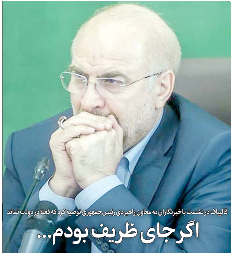
قالیباف در نشست با خبرنگاران به معاون راهبردی رئیس‌جمهوری توصیه کرد که فعلاً در دولت نماند