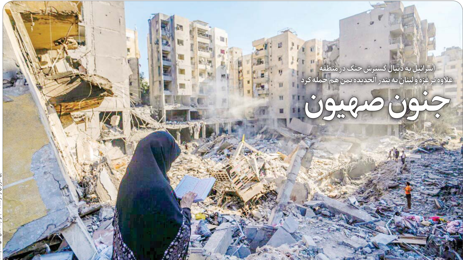
گزارش تینبریک را در صفحه ۲ بخوانید

اسرائیل به دنبال گسترش جنگ در منطقه علاوه بر غزه و لبنان به بندر الحیدیه یمن هم حمله کرد جنون صهیون