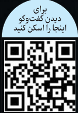
برای دیدن گفت‌وگو اینجا را اسکن کنید