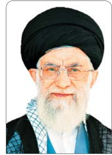
مقام معظم رهبری: