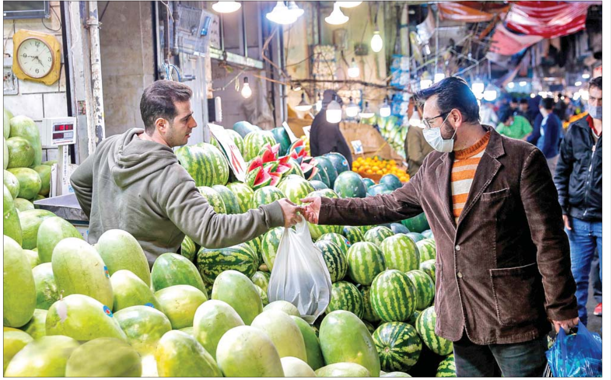
بازار خرید شب یلدا با وجود مشکلات اقتصادی، داغ بوده و مردم در حال تدارک برای این سنت دیرینه هستند.